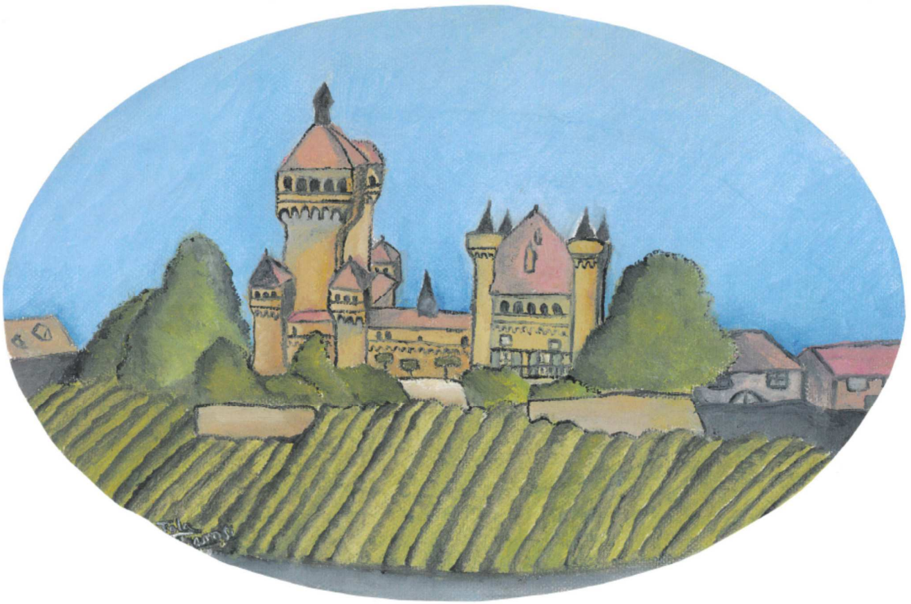
Peinture de Tala Chamsi, 14 ans, habitante de Vufflens-le-Château