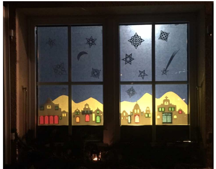
Le 20 - Famille Chollet