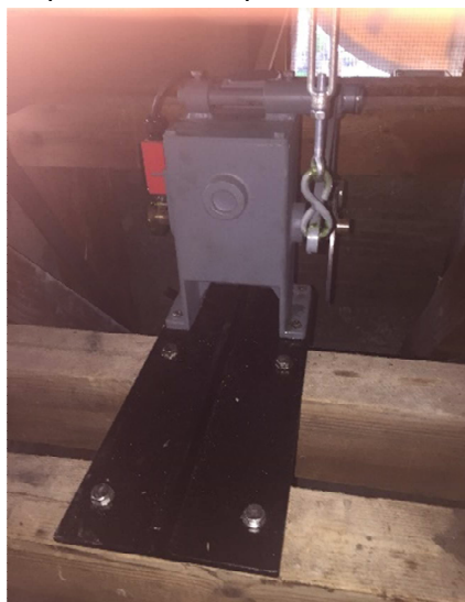
Nouveau moteur 2019

Les travaux exécutés sont les suivants :