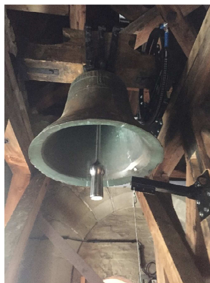
Cloche de 1481 nettoyée avec son nouveau battant

L'église réformée de Vufflens-le-Château a été construite en 1863-1864. Depuis le 23 octobre 1991, l'église ainsi que la cloche de 1481 figure à l'inventaire des Monuments et sites. La révision complète sera terminée au printemps 2020. Quelques travaux complémentaires doivent être encore exécutés.