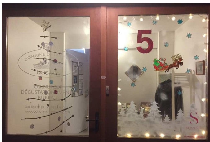
Le 5 - Familles Perey, domaine de la Balle