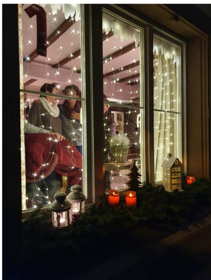
Le 1 er - Mme M.-C. Mellot

Voici les photos de toutes ces fenêtres :