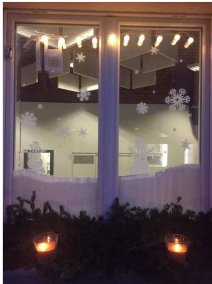
Le 18 - La Commune