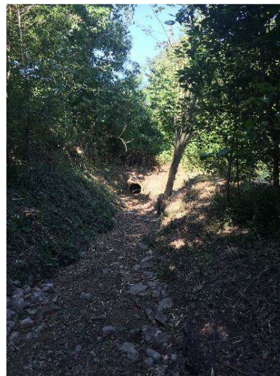
Le Curbit nettoyé avant mise en eau

Comme Vufflens ne possède aucune source d'eau à disposition sur son territoire, ce canal a permis une alimentation en eau précieuse pour le village, l'arrosage et la force hydraulique des différentes activités.