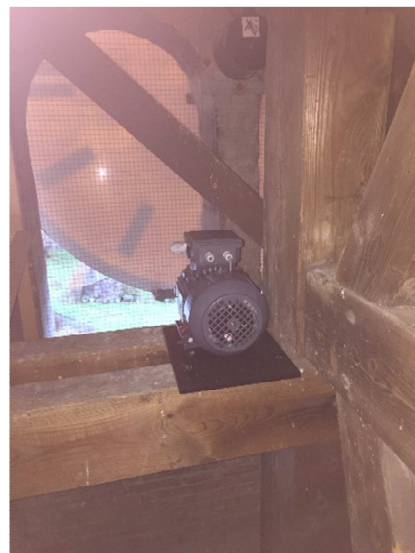
Ancien moteur de 1962