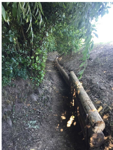
Consolidation des rives

La prise d'eau est captée sur un ouvrage créé à Bussy-Chardonney, en amont de l'entreprise Landi SA, sur le ruisseau du Grand-Curbit en provenance de Yens et qui se jette dans la Morges près du lieu-dit La Tuillière, limite entre les Communes de Bussy et Vufflens.