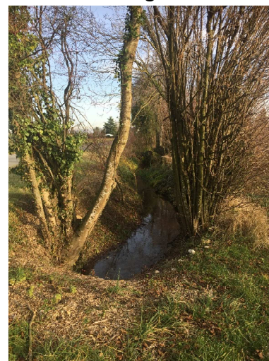
Aspect en décembre 2019

Ce canal remplit à nouveau son rôle pour notre village et ses habitants à la satisfaction de tous. Tous ces travaux se sont déroulés en accord avec notre service forestier, en respectant les directives de préservation du cordon boisé pour protéger l'harmonie du lieu.