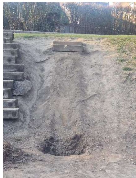
Emplacement du toboggan volé

Les enfants de notre village ont été très affectés par cette disparition.