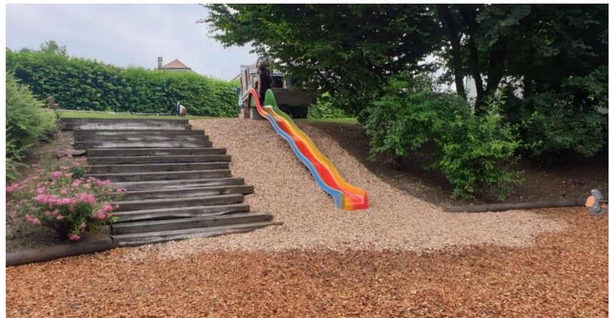
Nouveau toboggan sur son lit de copeaux

Nous avons remplacé le toboggan par un tout neuf et un peu plus long.