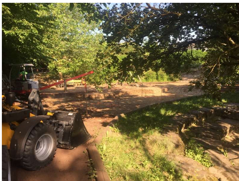
Extraction des anciens copeaux en profondeur

Les copeaux ont été remplacés en profondeur pour la sécurité des enfants.