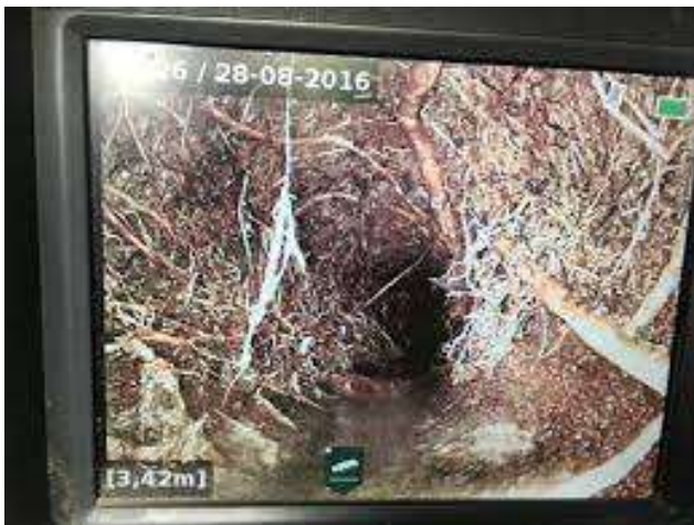
Canalisation obstruée par des racines

Le réseau d'eaux claires et usées de votre parcelle demande également un entretien régulier. Le curage des installations consiste à nettoyer les graisses, les restes de nourriture, les shampoings huileux et autres.