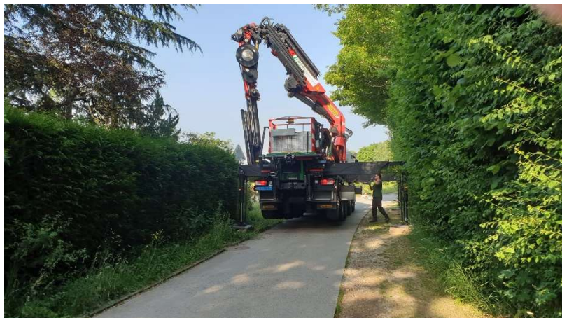
Préparation du camion-grue pour amener les matériaux sur le site

Les copeaux ont été remplacés en profondeur pour la sécurité des enfants.