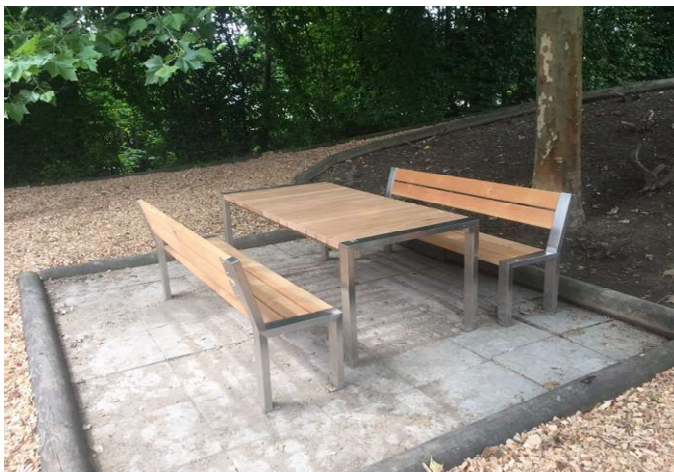
Table et bancs à disposition des usagers

La table et les deux bancs ont été également remplacés par un mobilier neuf, complété au sud de l'étang par un banc d'observation de la flore et des nénuphars permettant de voir discrètement la vie des grenouilles et des libellules.